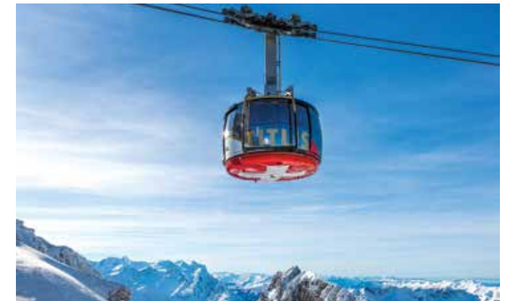
Téléphérique pivotant Titlis Rotair