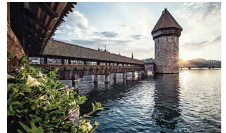
Pont de la Chapelle, Lucerne

LUZERN+ THE CITY. THE LAKE. THE MOUNTAINS.