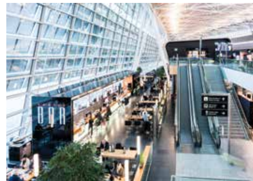
Aéroport de Zurich

Cet aéroport offre le Wi-Fi gratuit, des services aux familles avec bébés et enfants (infirmières et aires de jeux), une gastronomie typiquement suisse et plus encore. L'Airside Center se révèle l'endroit parfait pour les voyageurs qui souhaitent parcourir les boutiques exclusives, faire des achats de produits suisses tels que chocolats et montres ainsi que réserver leurs produits hors-taxes en ligne grâce au service "Précommande". Pour magasiner les produits suisses comme les chocolats et les montres ou pour commander des produits hors-taxes en ligne, il suffit d'avoir recours au service "Réservez & Ramassez".