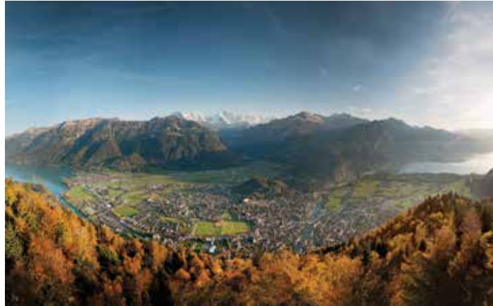
Vue d'Interlaken, depuis le Harder Kulm, Oberland bernois

Interlaken se trouve au centre de la Suisse, entre les lacs de Thoune et de Brienz et juste en-dessous d'un trio montagneux de renommée mondiale : "Eiger, Mönch & Jungfrau". Cette petite ville est le centre touristique de la région et un lieu de rencontre pour les visiteurs venus du monde entier.