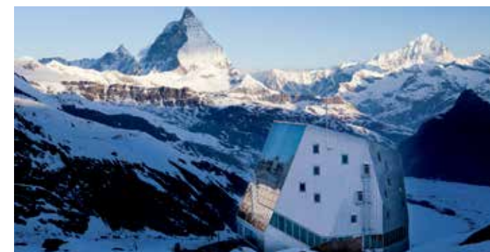
Cabane du Mont Rose, Zermatt, Valais