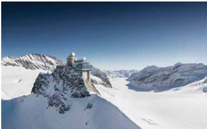
Chemins de fer de la Jungfrau, Oberland bernois

Durant toute l'année, les visiteurs ont accès à un monde merveilleux de glace, de neige et de pierre de haute montagne. Depuis la terrasse Le Sphinx, les vues à 360 degrés, qui s'étendent sur le Glacier de l'Aletsch, inscrit au Patrimoine Mondial de l'UNESCO, sont époustouflantes. Le train voyage jusqu'à la plus haute gare d'Europe, à 11 330 pieds / 3 450 m d'altitude.