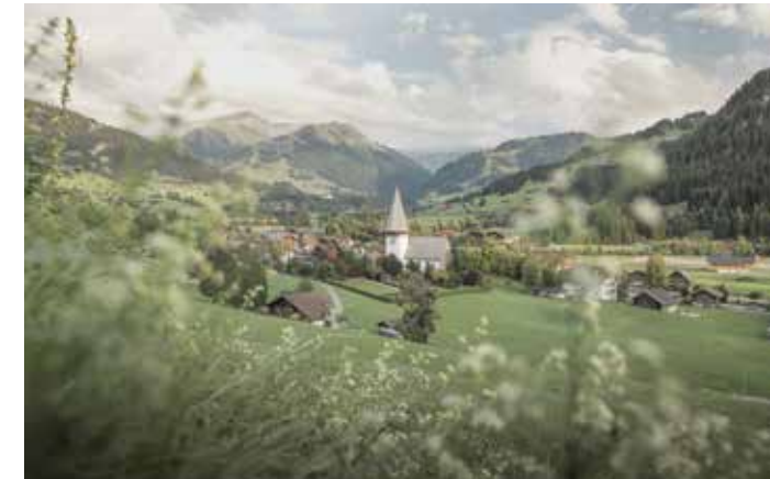
Gstaad, Oberland bernois

Blotti dans les montagnes de l'Oberland bernois, Gstaad est accessible en train avec le populaire Golden Pass panoramique. Gstaad jouit d'un statut de prestige. Mais en dépit de cette popularité, il sait garder son charme et ses traditions authentiques. Aux dires de la légende Julie Andrews: "Gstaad est le dernier paradis dans ce monde de fou".