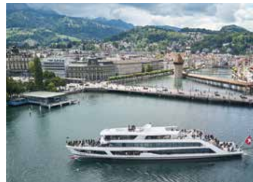
Bateau à moteur "Diamant" dans la baie de Lucerne