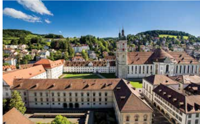
Domaine collégiale de St-Gall

St-Gall est la plus grande ville suisse donnant sur le Lac de Constance. Ses airs urbains se fondent à la nature, entre le lac et le Mont Säntis. Ville du Patrimoine Mondial de l'UNESCO, St-Gall propose une variété d'activités culturelles. Célèbre pour son hall baroque, la bibliothèque de la cathédrale de St-Gall est l'une des plus anciennes au monde.