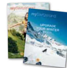
Magazines sur les vacances hivernales et estivales en Suisse