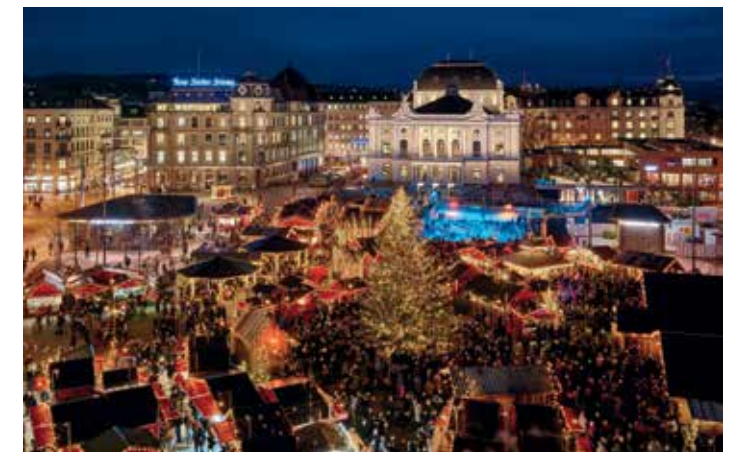
Village de Noël, Zurich