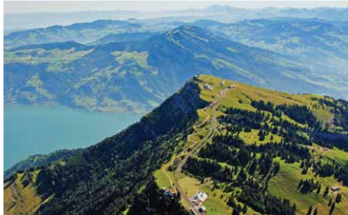
Mont Rigi, région du Lac des Quatre-Cantons

Le sommet du Mont Rigi offre des vues grandioses à 360°. Le train à crémaillère qui relie Goldau à Vitznau (le plus ancien train de montagne d'Europe, qui remonte à 1871) et le téléphérique qui monte le Rigi depuis Weggis, permettent d'aller et venir de plusieurs façons. Pour des escapades encore plus inoubliables.