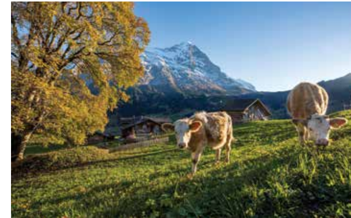
Région de la Jungfrau, Oberland bernois

La Région de la Jungfrau vous invitent à ses différentes activités. Les villages de montagne de Grindelwald, Wengen, Mürren et Lauterbrunnen ainsi que le Haslital forment un décor majestueux. Ici, place à une foule d'activités d'été et d'hiver et des hébergements allant des appartements de vacances charmants à des propriétés 5 étoiles.