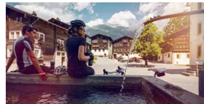
Cyclistes à Ernen, dans le Valais.

Avec ses nombreux lacs et glaciers et l'eau naturellement contenue dans ses sols, la Suisse dispose de réserves d'eau en quantité plus élevée que la moyenne. Seulement 2 % de l'eau de pluie alimente nos réserves d'eau à boire. La majorité est puisée dans des lacs artificiels et barrages qui produisent de l'électricité. Plus de la moitié de l'électricité produite en Suisse provient de ces sources – en d'autres mots, il s'agit d'énergie renouvelable, sans CO2!