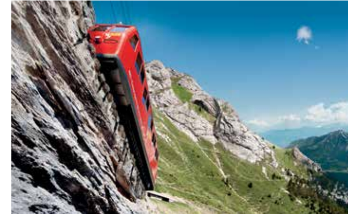
Train à crémaillère du Mont Pilate

Mont emblématique de Lucerne et plus proche parcours en montagne au départ de la ville, le Mont Pilate est le massif parfait. Avec sa grande variété d'attraites, il offre un cadre alpin unique, où l'histoire et le futur se rencontrent.