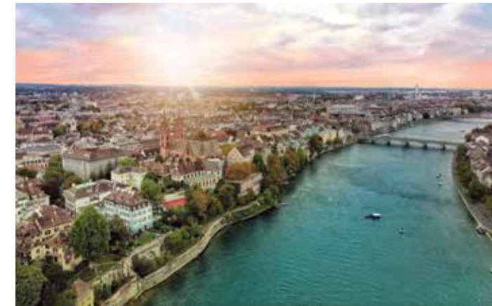
La Vieille Ville de Bâle le long du Rhin

Cette ville de culture abrite près de 40 musées et présente de nombreux événements de haut calibre. L'art s'exprime partout dans la ville et de sublimes contrastes sont créés par les maisons patriciennes classiques voisinant les édifices modernes conçus par des architectes de Bâle comme Herzog & de Meuron ou Renzo Piano.