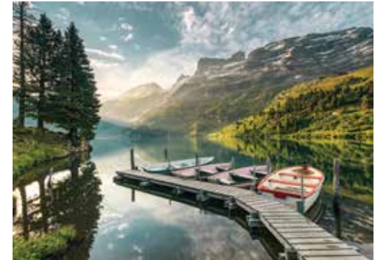
Innertkirchen, Oberland bernois

Le Switzerland Travel Centre est une compagnie suisse de gestion de destination qui appartient à l'Association Hôtelière Suisse "hotellerie-suisse", à Suisse Tourisme, à la Swiss Federal Railways SBB et à des compagnies ferroviaires régionales privées.