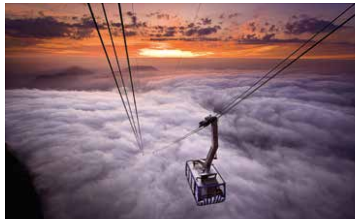
Mont Säntis, Suisse orientale / Appenzellerland

À 8 207 pieds / 2 502 mètres d'altitude, vous apprécierez la vue panoramique unique au-dessus de pas moins six pays, les Alpes et les vallées. Parcourez le nouvel "Experiential World", qui fait de la glace et la météo en milieu alpin ses sujets d'explication. Ici, les chemins de montagne, les terrasses et les restaurants invitent les visiteurs à l'évasion-découverte et la dégustation de délices culinaires.