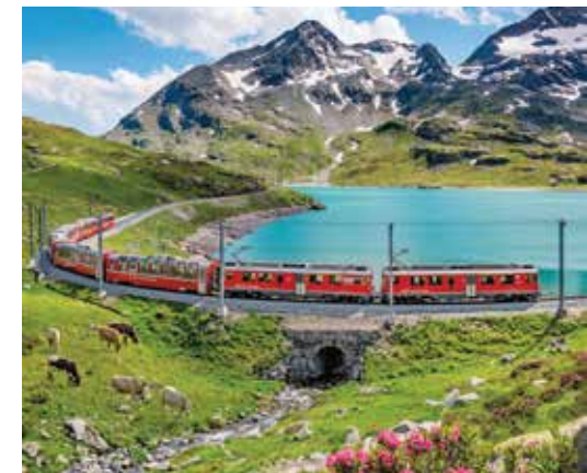
Bernina Express au Lago Bianco