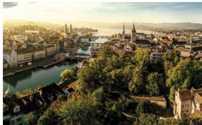
Vieille Ville de Zurich, donnant sur la Limmat

Capitale du design d'Europe, Zurich est synonyme d'architecture, expressions artistiques, arts visuels et design sublimes. Explorez la ville ou faites du tourisme hors de la ville pour y revenir le soir venu, et plonger dans sa scène culinaire savoureuse dans les restaurants qui vont des temples de la fine cuisine aux tavernes historiques et cantines éphémères.