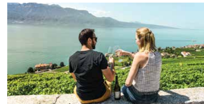
Vignobles de Lavaux, Région du Lac Léman