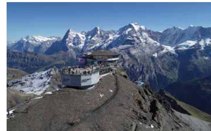
Schilthorn - Piz Gloria, Oberland bernois

La région du Schilthorn propose l'aventure montagnaise ultime. Le sommet du Schilthorn (9 744 pieds/2 970 m) offre des vues panoramiques inégalées d'un paysage alpin inscrit au Patrimoine Mondial de l'UNESCO, qui compte les sommets Eiger, Mönch et Jungfrau – le tout étant une destination parfaite pour une excursion mémorable!