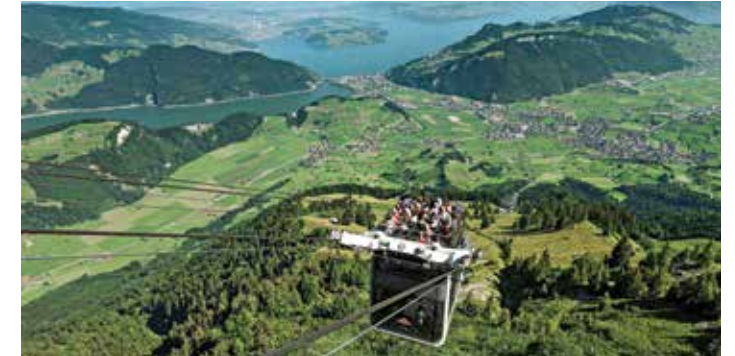
Téléphérique du Stanserhorn, Région du Lac des Quatre-Cantons

Avec des correspondances possibles à bord d'un train, d'un bus, d'un bateau ou d'un train de montagne, vos clients peuvent facilement atteindre leur point de départ pour amorcer leur randonnée. Jumeler la montée du Mont Stanserhorn avec une randonnée inoubliable est un exemple: on embarque à bord d'un ancien funiculaire puis sur le toit du téléphérique moderne CabriO.