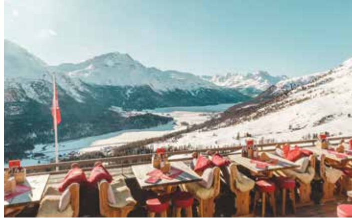
Restaurant & Club El Paradiso, St. Moritz