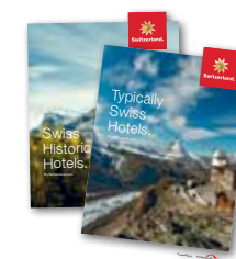
Brochures sur l'aventure, les hôtels et les villes