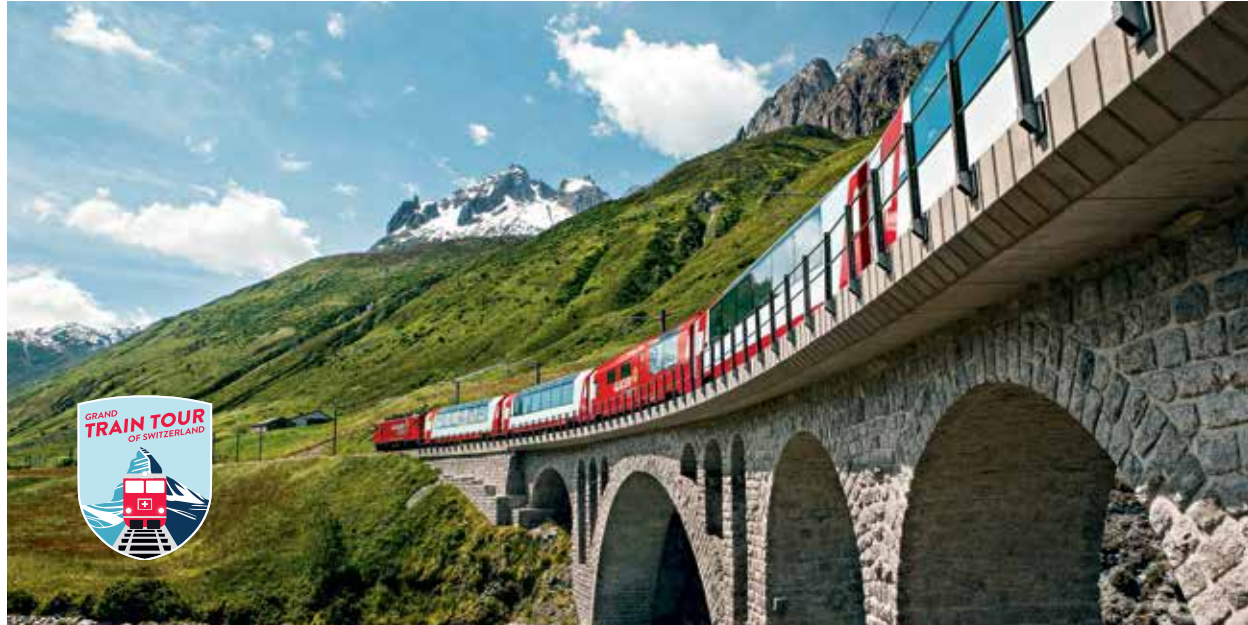
Glacier Express en Suisse centrale

Le Grand Train Tour of Switzerland regroupe les plus belles routes ferroviaires panoramiques premium en un seul trajet. Ce circuit s'étire sur un total de 1 280 km (795 miles) et est accessible à n'importe quel moment de l'année. On peut débuter ce circuit de n'importe où et il n'y a pas qu'un sens unique, ni une durée prédéterminée. Mieux que tout : on peut parcourir ce magnifique tour avec un seul ticket : le Swiss Travel Pass.