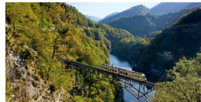
Camedo, Centovalli Railway, Tessin

Les voyages en train incarnent la mobilité écologique en Suisse. Les Chemins de fer fédéraux suisses sont un mode de transport respectueux du climat et sécuritaire pour 1,25 million de passagers et 205 000 tonnes métriques de marchandises, chaque jour. Propulsés par l'hydroélectricité à 90 % en plus d'être un réseau entièrement électrifié, ils forment l'une des compagnies ferroviaires les plus écologiques d'Europe. company.sbb.ch/en