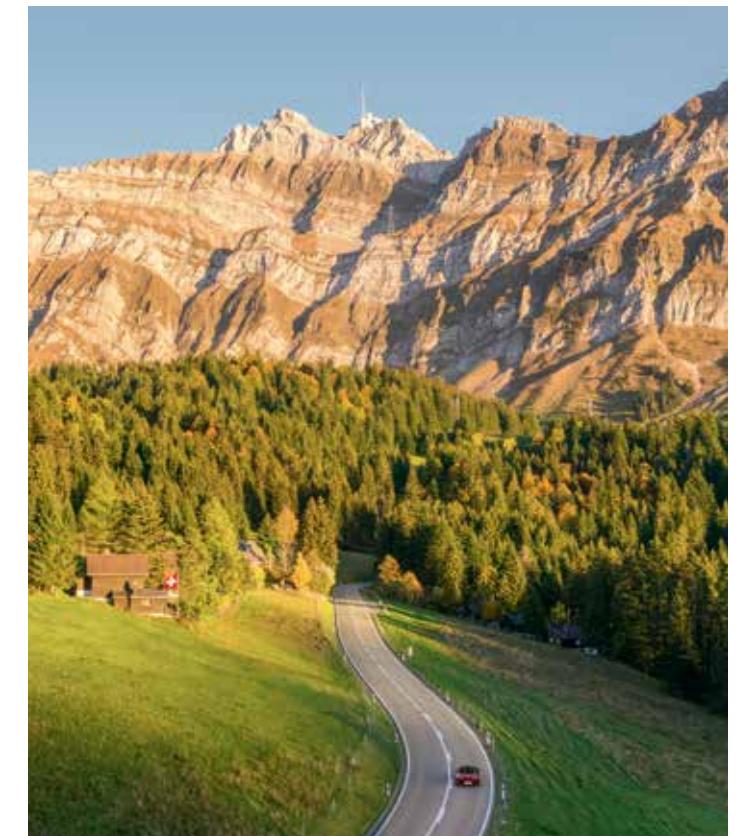
Mont Säntis, Appenzel

Les hôtels qui parsèment le Grand Tour de Suisse répondent aux goûts de chacun et sont situés dans les quatre régions linguistiques du pays. MySwitzerland.com/grandtourhotels