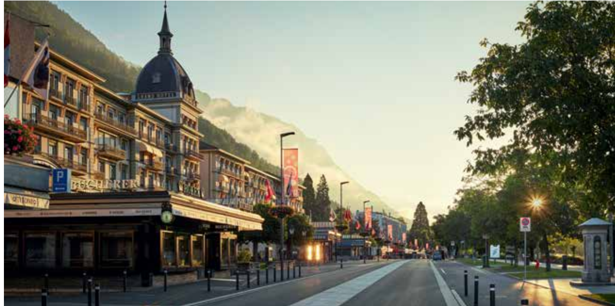
VICTORA-JUNGFRAU Grand Hotel & Spa, Interlaken

Depuis des siècles, les Suisses scrutent leur clientèle. Aujourd'hui, ils savent comment assouvir ses besoins et désirs, et ils sont reconnus pour leur accueil raffiné. Vous trouverez ici des recommandations d'hôtels de Suisse Tourisme.