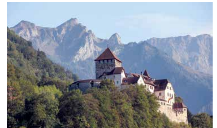
Château de Vaduz en été.