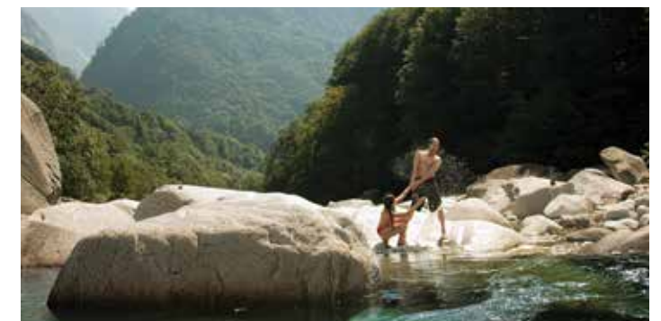
Vacances actives – Randonnées combinées.

En balade le long de la rivière, parmi les maisons de pierre typiques de ce coin de pays, vos clients découvriront un paysage sublime du Tessin. Une fois à Lavertezzo, ils pourront savourer une baignade rafraîchissante dans les eaux turquoise du Val Verzasca et admirer la vue privilégiée sur le pont de pierre à deux arches.