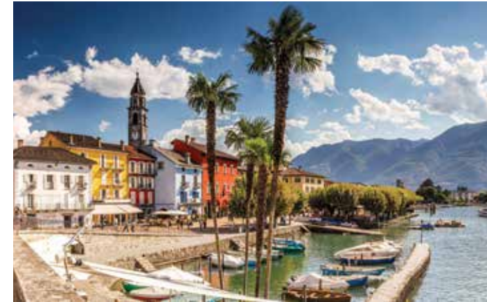
Ascona, Lac Maggiore, Tessin

Le Tessin occupe le sud de la Suisse. Ici, le climat est doux, les gens chantent en italien, mangent bien et embrassent le côté ensoleillé de la vie. Les visiteurs sont en émoi devant la grande diversité: lacs pittoresques, villes de charme baignées de musique, vallées vierges et un important réseau de sentiers pédestres sublimes.