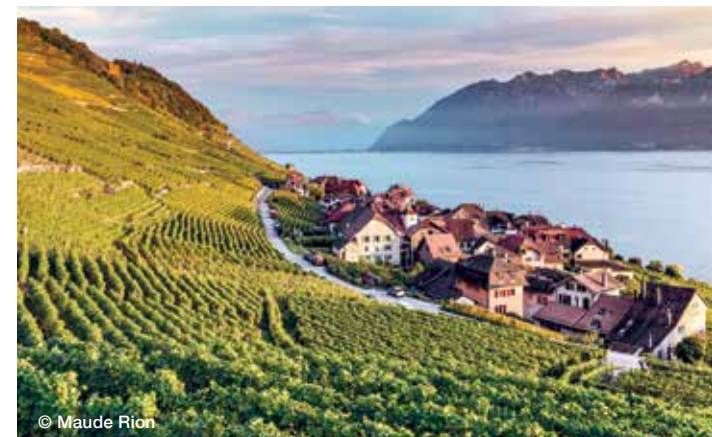
Lavaux, un site du Patrimoine Mondial de l'UNESCO

Les incontournables sont la célèbre fontaine de Genève – le "Jet d'Eau", le vignoble en terrasses de Lavaux – inscrit au Patrimoine Mondial de l'UNESCO, et le grand Glacier d'Aletsch. Riche de la plus grande densité de restaurants étoilés Michelin en Suisse, cette destination est synonyme de spécialités culinaires et vins inégalés. Cette zone francophone de Suisse vous attend, tout simplement!