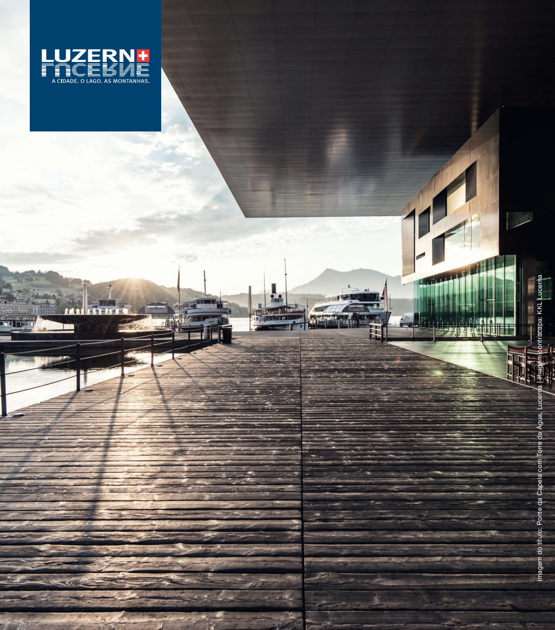
Imagem do título: Ponte da Capela com Torre da Água, Lucerna | Imagem contracapa: KKL Lucerna