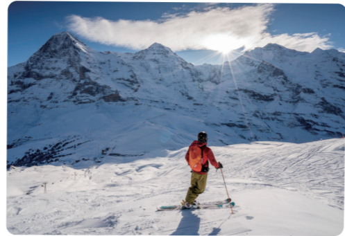
5 少女峰地区 Jungfrau Region