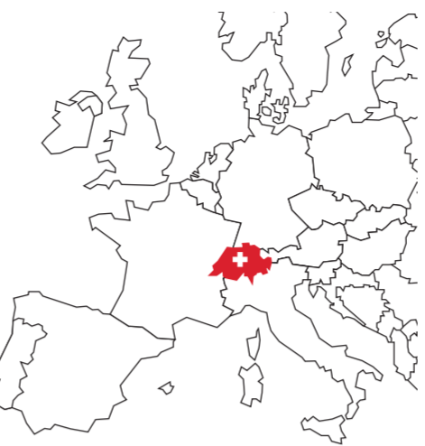
1 阿罗萨 Arosa