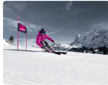
6 雪朗峰 Schilthorn