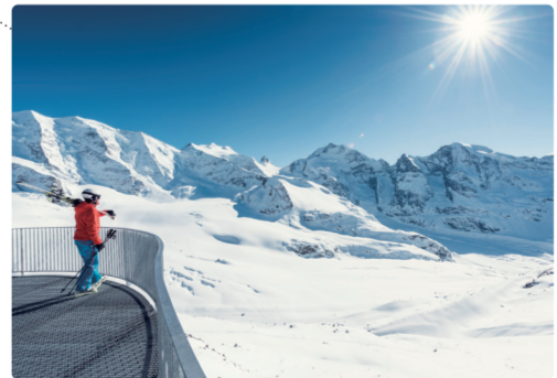
4 圣莫里茨 St. Moritz