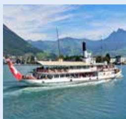
乌里号 URI 1901年 容纳800人 166个宴会坐席