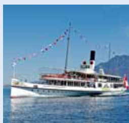
下瓦尔登号 UNTERWALDERN 1902年 容纳700人 171个宴会坐席