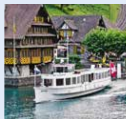
梅塞恩号 MYTHEN 容纳200人 48个宴会坐席