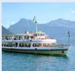
欧罗巴号 EUROPA 容纳1000 282个宴会坐席