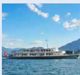
温克尔里德号 WINKE LRIED 容纳700人 174个宴会坐席