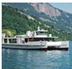
双体船席勒号 CATAMARAN CIRRUS 容纳300人 120个宴会坐席