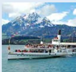
席勒号 SCHILLER 1906年 容纳900人 110个宴会坐席