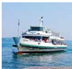
弗吕伦号 FLUELEN 容纳400人 166个宴会坐席