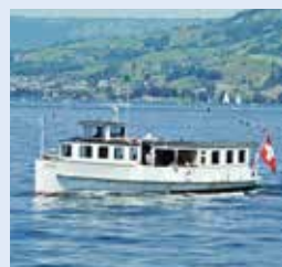
吕特利号 RUTLI 容纳140人 36个宴会坐席