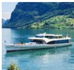
全景游艇蓝宝石号 SAPHIR 容纳300人 80个宴会坐席