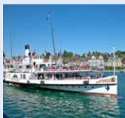
琉森号 STADT LUZERN 1928年 容纳1100人 290个宴会坐席