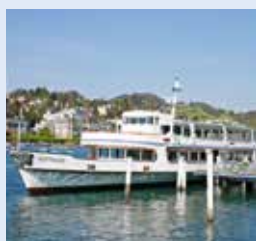
圣哥达号 GOTTHARD 容纳700人 290个宴会坐席