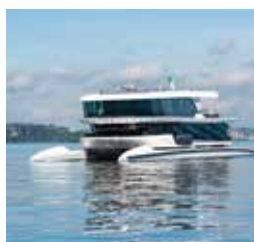
布尔根施托克号 BURGEN- STOCK SHUTTLE 容纳300人