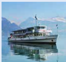
瓦尔德斯塔特号 WALDSTATTER 容纳700人 276个宴会坐席