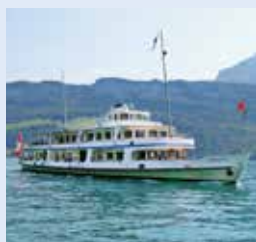
施维茨号 SCHWYZ 容纳900人 190个宴会坐席