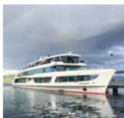
钻石号 DIAMANT 容纳1100人 400个宴会坐席