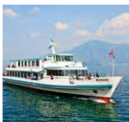
布鲁嫩号 BRUNNEN 容纳400人 166个宴会坐席