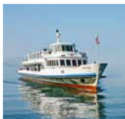
韦吉斯号 WEGGIS 容纳500人 152个宴会坐席