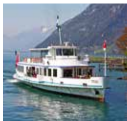
铁力士号 TITLIS 容纳300人 96个宴会坐席