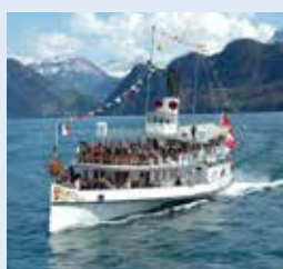
高卢号 GALLIA 1913年 容纳900人 98个宴会坐席