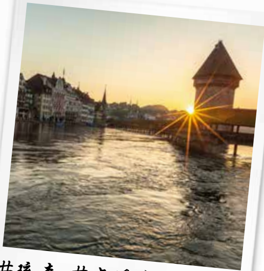
井琉森 井卡佩尔桥