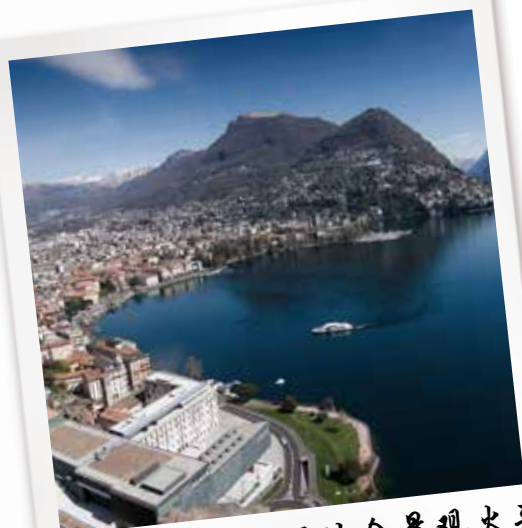
井卢加诺 井圣哥达全景观火车