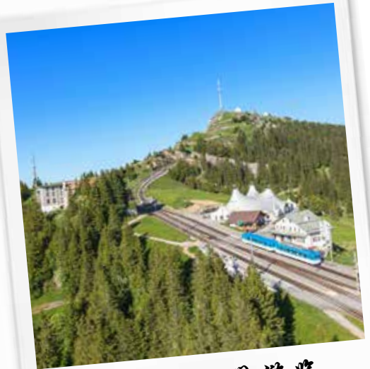
井瑞吉山 井山间游览