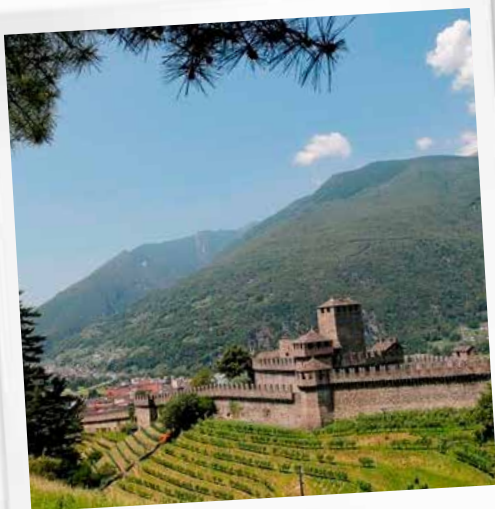
井贝林佐纳 井城堡