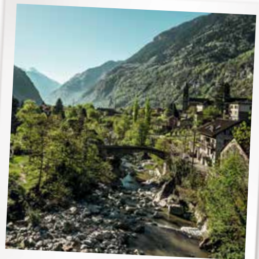
井提契诺州 井焦尔尼科