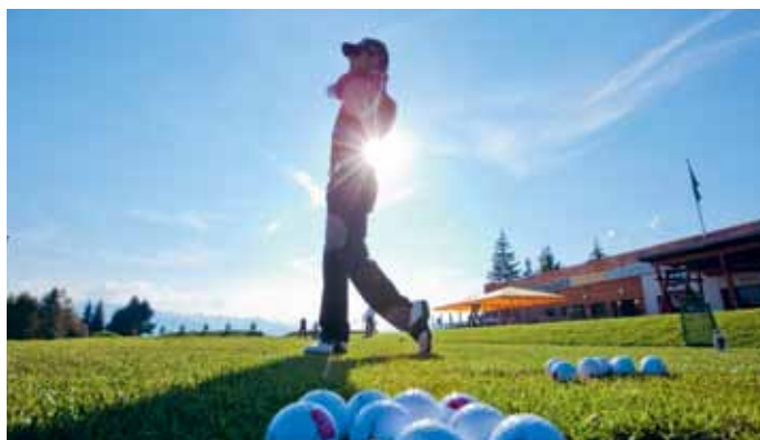
在克莱恩·蒙塔纳打高尔夫球体验 瓦莱州