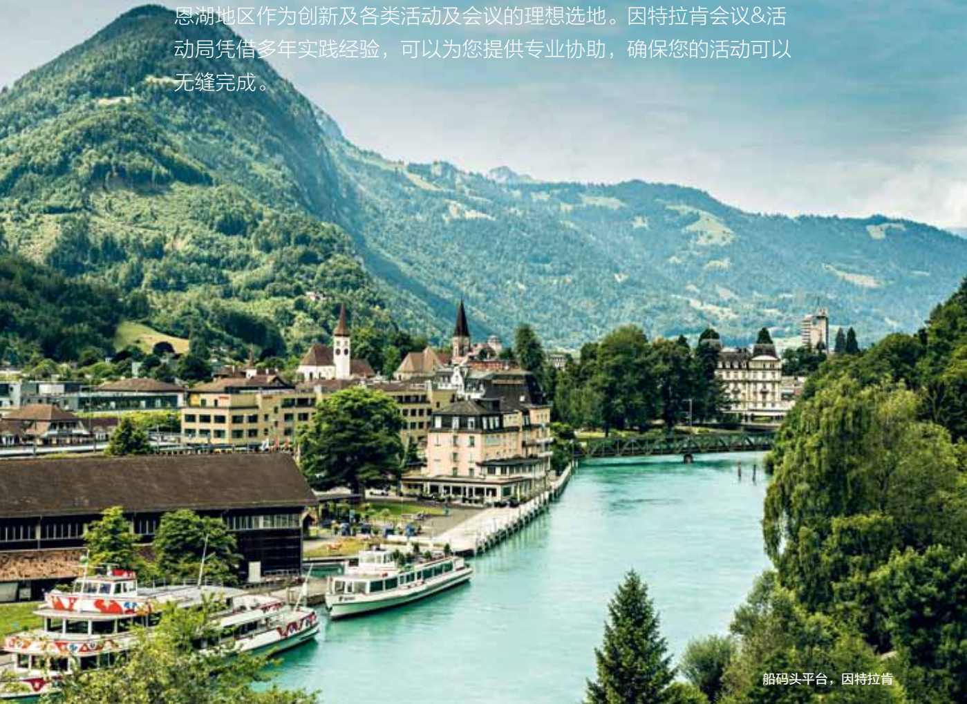
船码头平台，因特拉肯

位于欧洲心脏位置，因特拉肯和图恩-图恩湖地区作为创新及各类活动及会议的理想选地。因特拉肯会议&活动局凭借多年实践经验，可以为您提供专业协助，确保您的活动可以无缝完成。