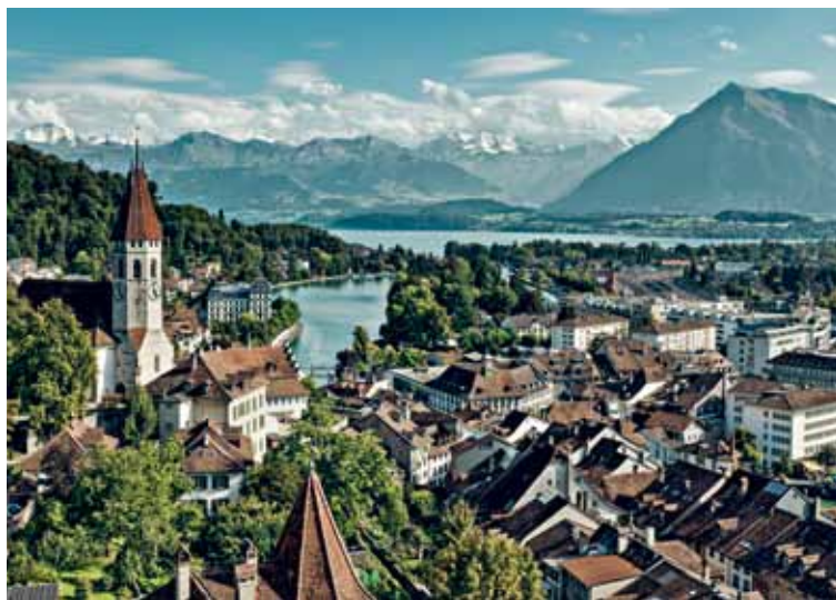
图恩，伯尔尼沃韦，卓别林互动博物馆，日内瓦湖区