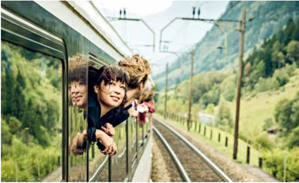
圣哥达全景观快车