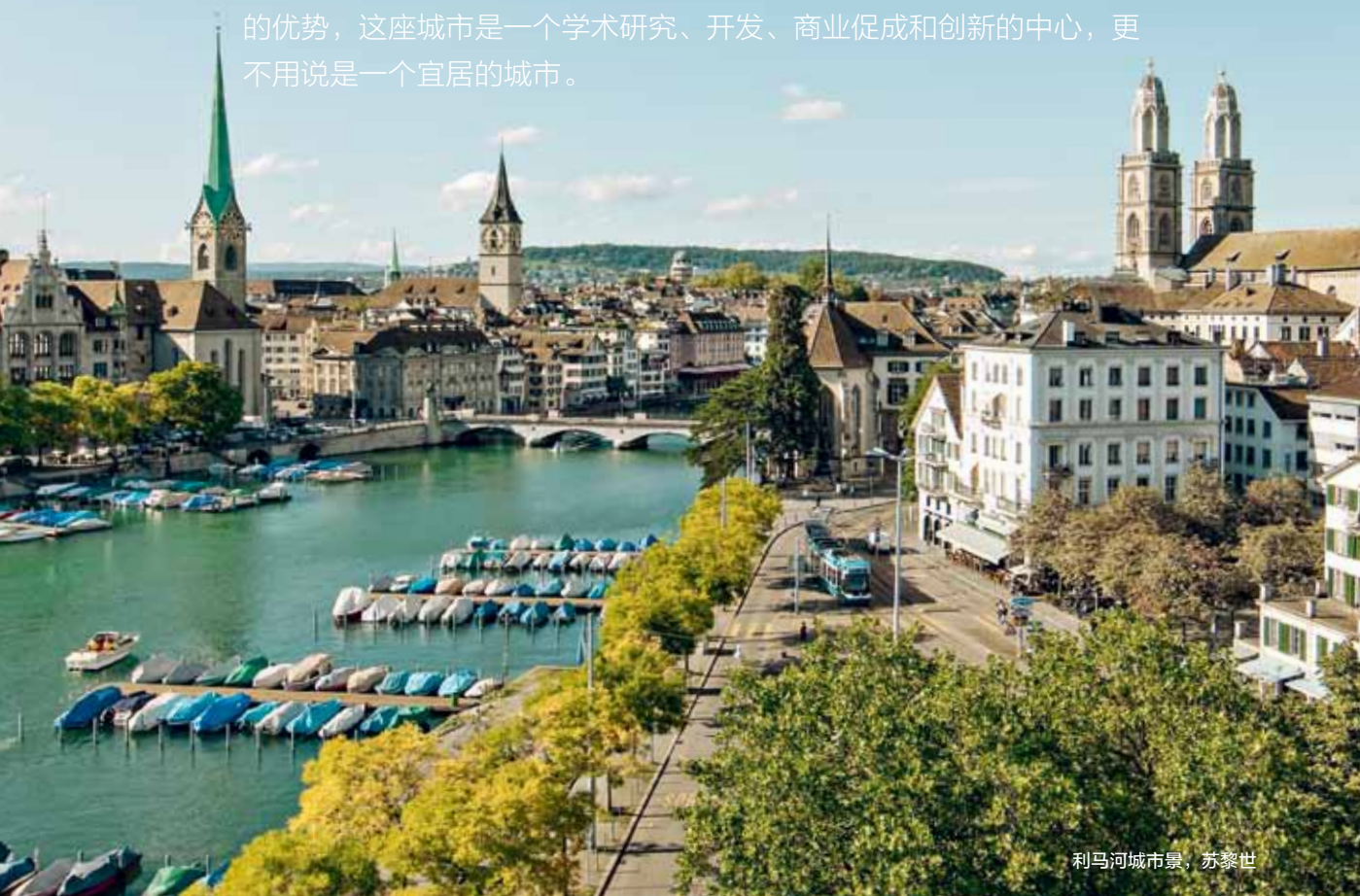
利马河城市景，苏黎世

经济中心，大学城和灵动精致的都市氛围带来了高品质的生活保障：苏黎世位于阿尔卑斯山脚下，具备优美自然风光与现代城市卓越的基础设施、强大的商业网络、科研和雄心勃勃的初创企业的优势，这座城市是一个学术研究、开发、商业促成和创新的中心，更不用说是一个宜居的城市。