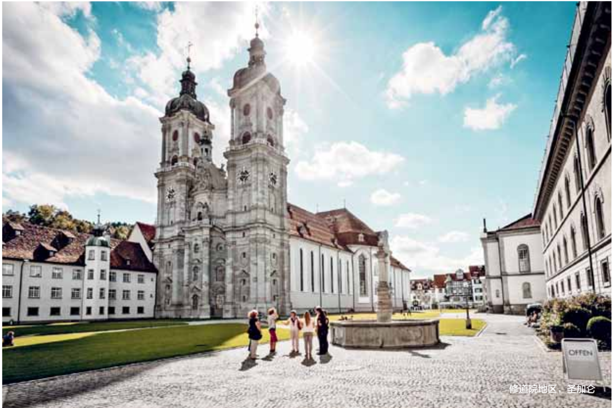
修道院地区、圣加伦