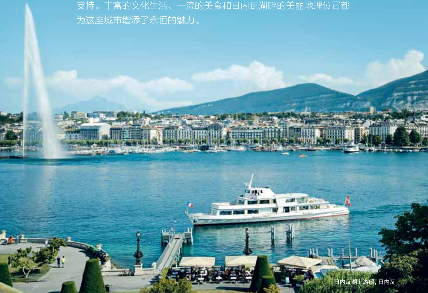
日内瓦湖上游船，日内瓦

日内瓦 作为许多国际组织的总部和举办一些世界领先的贸易博览会，日内瓦拥有确保任何会议或奖励旅行的配套设施和专业支持。丰富的文化生活、一流的美食和日内瓦湖畔的美丽地理位置都为这座城市增添了永恒的魅力。