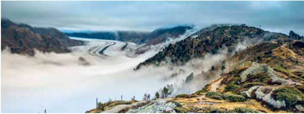
阿莱奇冰川， 瓦莱州