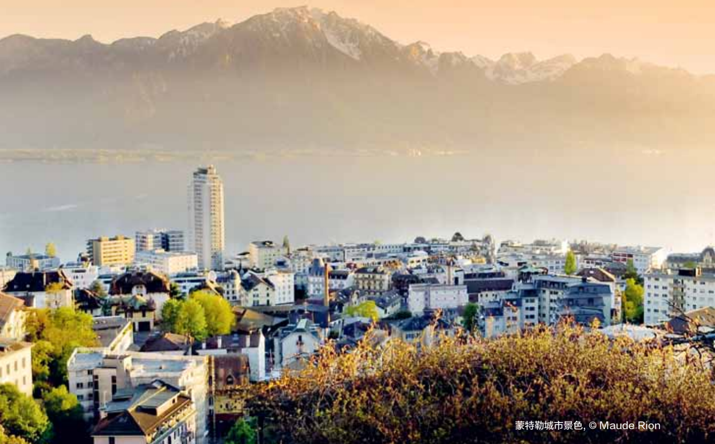
蒙特勒城市景色

位于日内瓦湖区和阿尔卑斯山脉之间，环绕着葡萄园和棕榈树，蒙特勒里维埃拉提供了一个独特的环境，可以距离日内瓦机场仅一小时的路程内举办令人难忘的活动。独特的活动地点和丰富的活动选择使蒙特勒里维埃拉成为研讨会和奖励旅行的理想目的地。