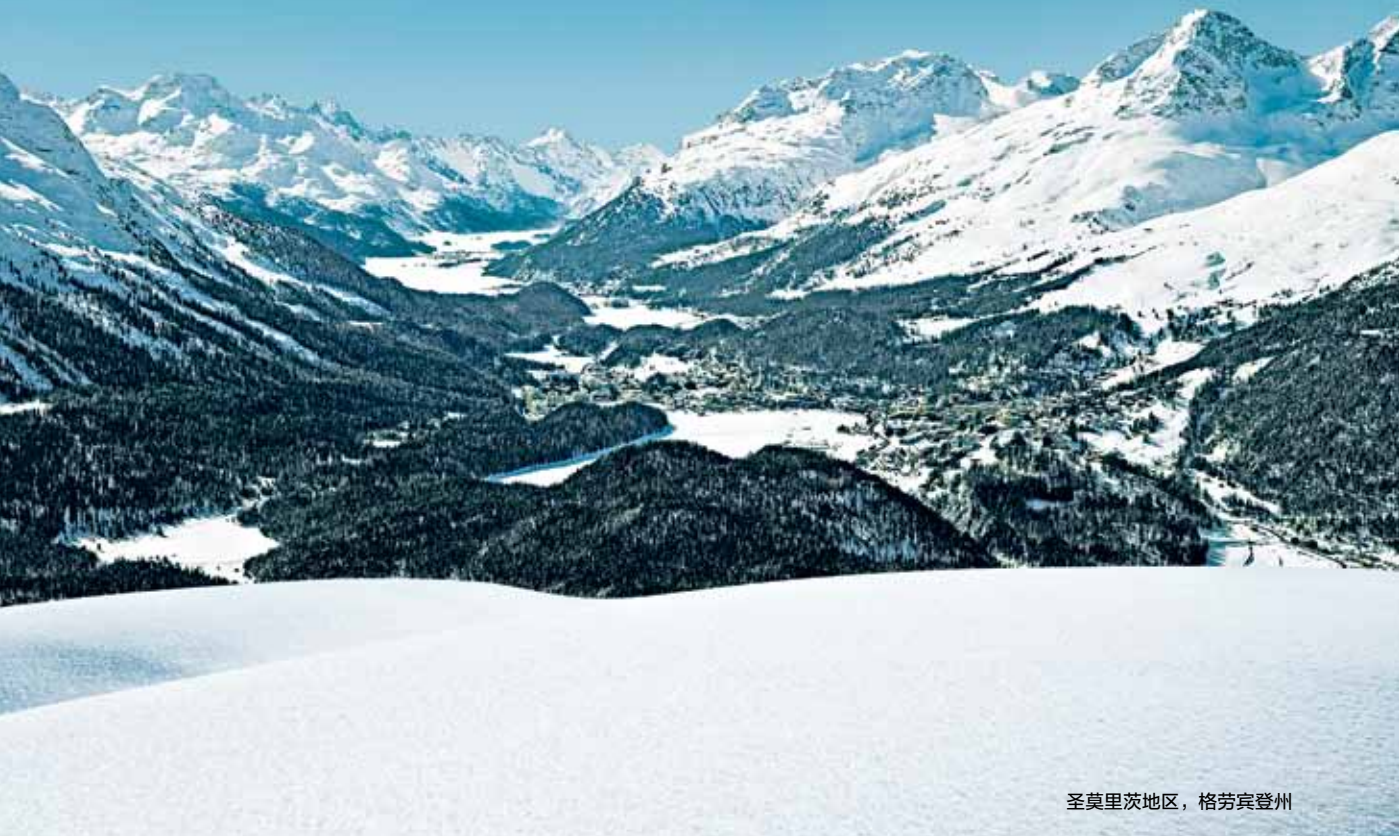
圣莫里茨地区，格劳宾登州

海拔1800多米，每年拥有充沛的阳光，圣莫里茨地区以洁净无瑕的湖水与震撼人心的山景闻名于世：在这提供与自然浑然一体的会议场所和奖励活动项目。