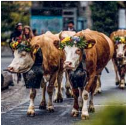
格施塔德，伯尔尼高地 莱迪亚布勒雷，冰川3000， 日内瓦湖区