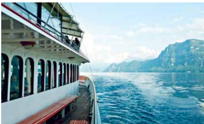
琉森湖上蒸汽船, 琉森-琉森湖地区