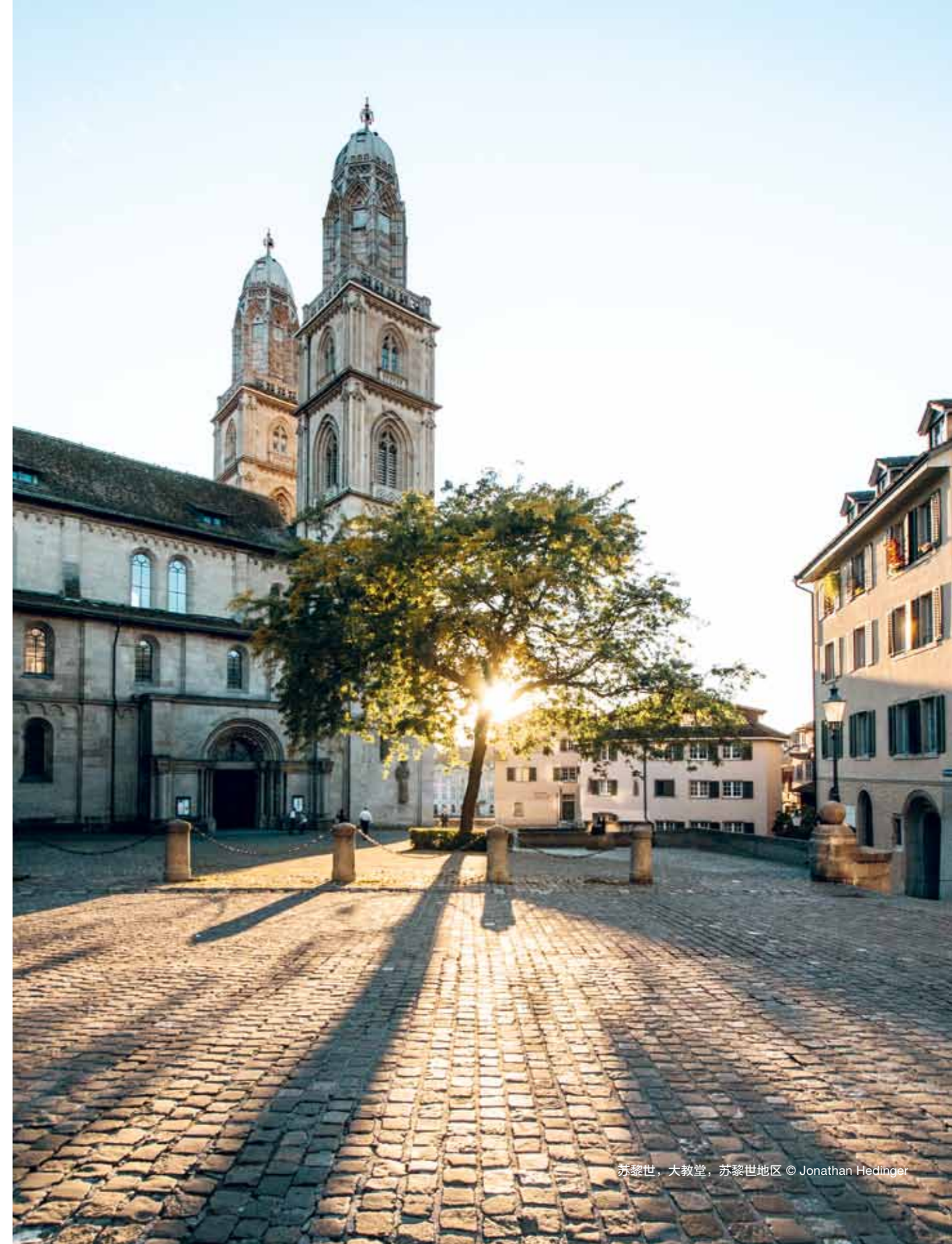
苏黎世, 大教堂, 苏黎世地区