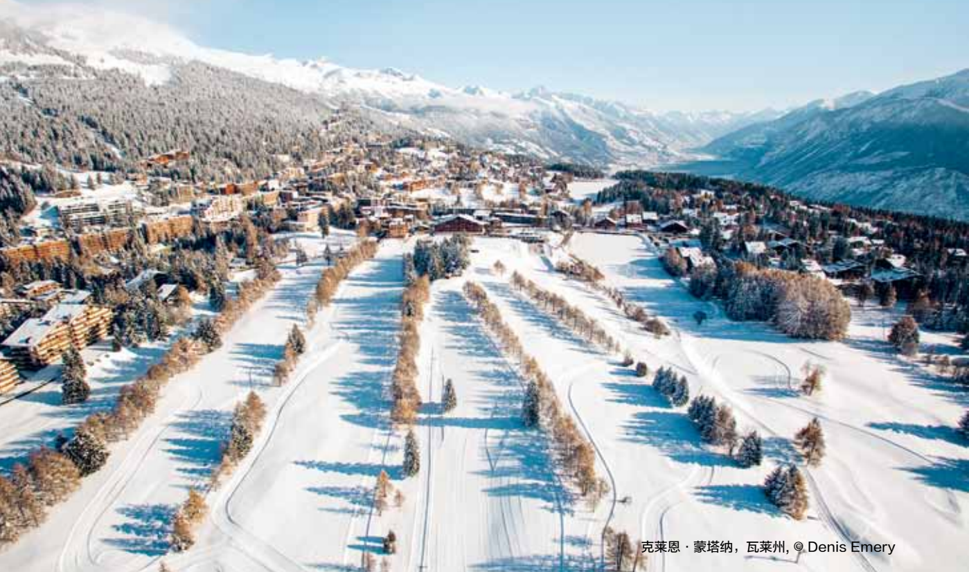
克莱恩·蒙塔纳，瓦莱州，© Denis Emery

克莱恩·蒙塔纳是组织专业或私人活动的理想目的地：这里有传统或非常规的会议地点，展览中心，多种不同标准的住宿选择，以及大量的体验项目可以安排，使得您的活动令人记忆深刻。