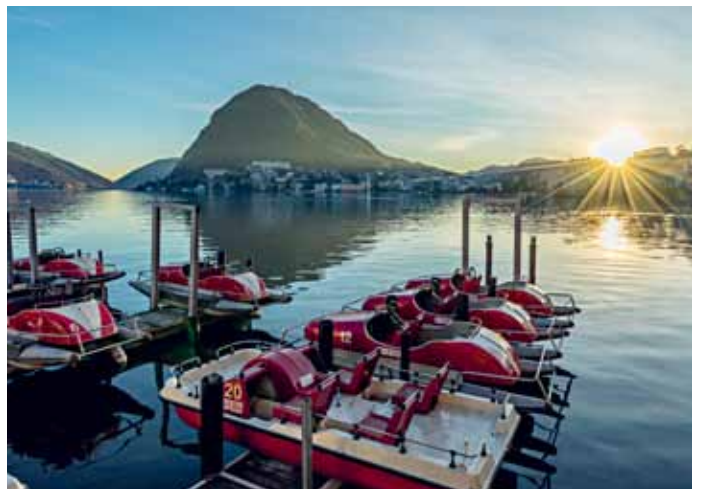
卢加诺湖， 提契诺州

瑞士气候温和，根据海拔高度和当地地形的不同差别很大。在蒙特勒或者提契诺州偏地中海气候，而国内最高的山峰是保持终年冰雪覆盖。我们可以根据您的行程及活动安排，给您提供专业的着装建议。