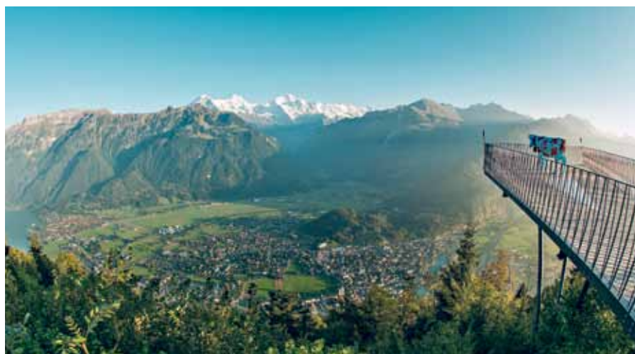
观景平台， 因特拉肯