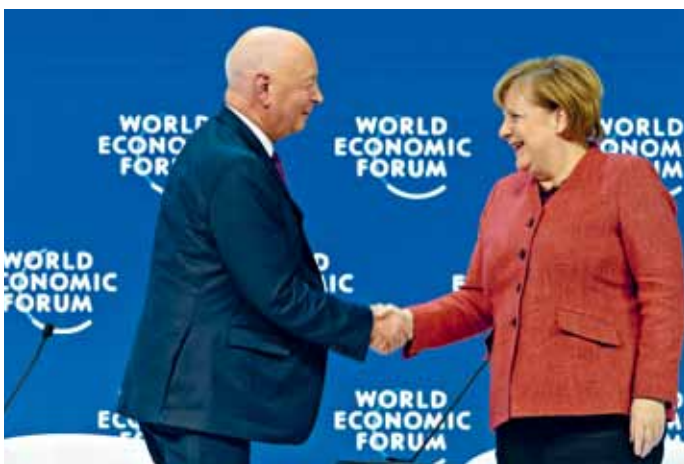
世界经济论坛峰会 (WEF), 达沃斯