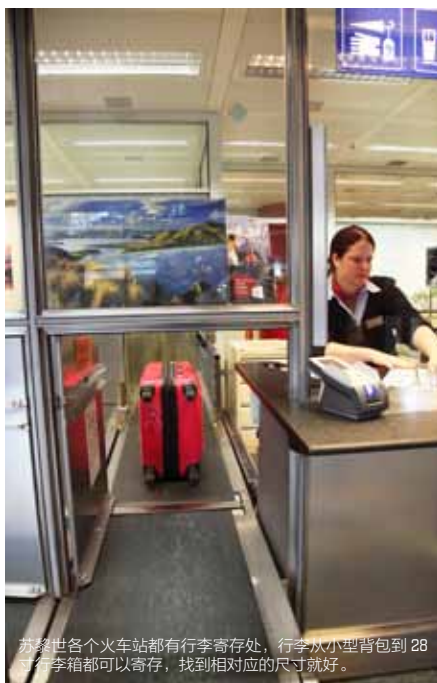
苏黎世各个火车站都有行李寄存处，行李从小型背包到 28 寸行李箱都可以寄存，找到相对应的尺寸就好。