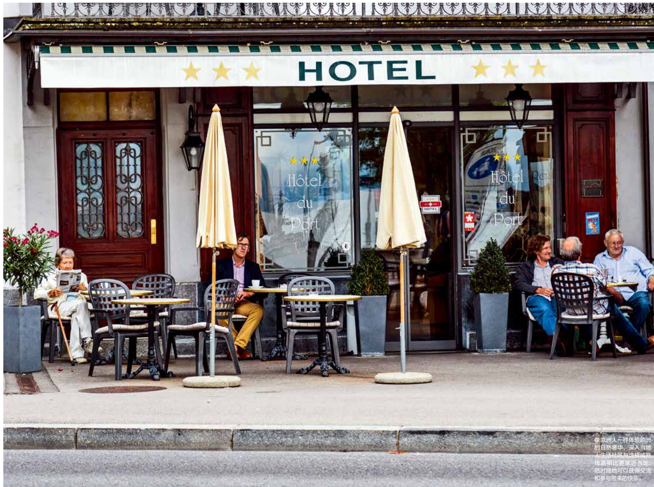
像欧洲人一样体验欧洲的自然奢华，深入当地人生活社区与选择成熟线路相比更亲近当地，随时随地可以获得交流和参与带来的快乐。