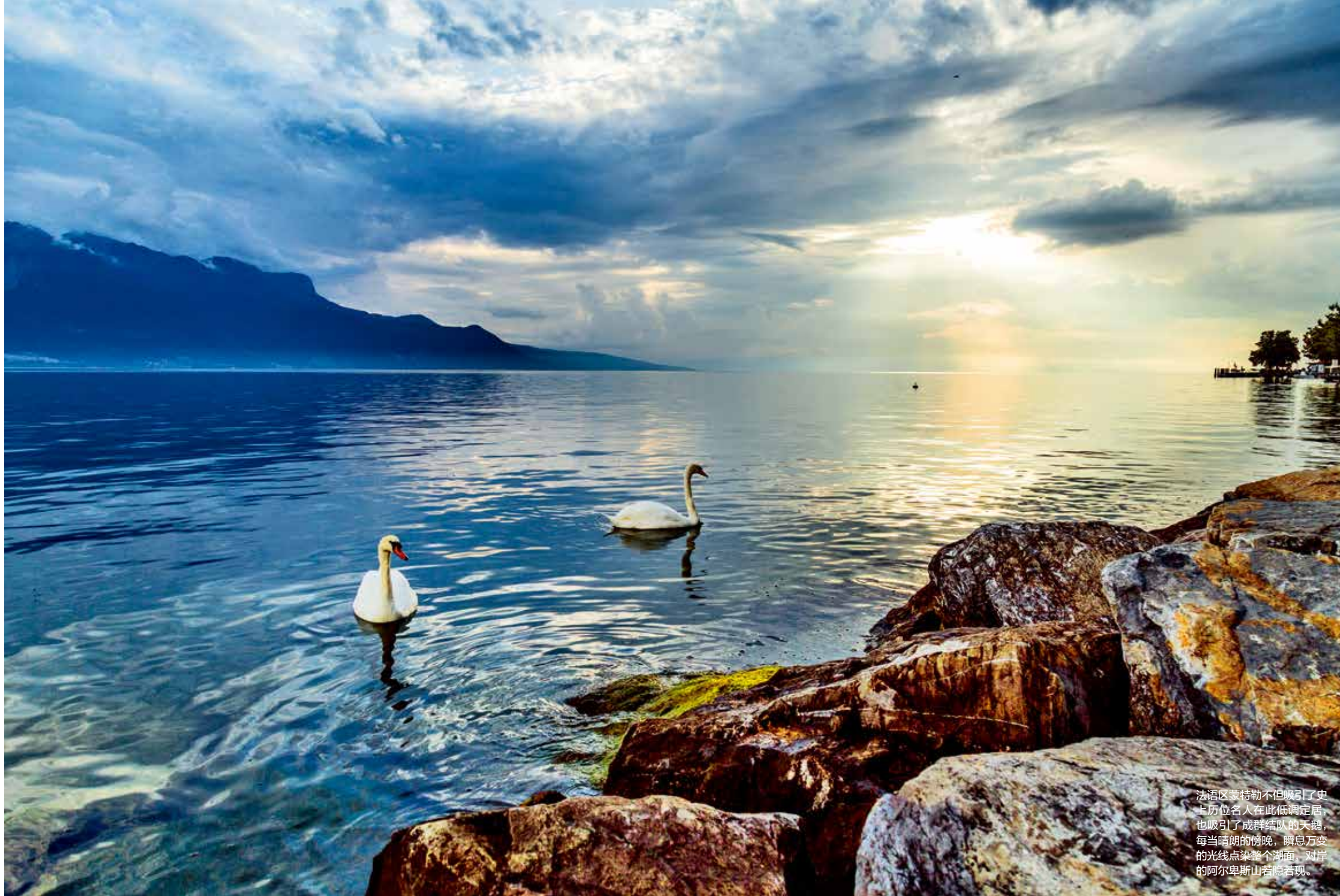
法语区蒙特勒不但吸引了史上历代名人在此低调定居，也吸引了成群结队的天鹅，每当晴朗的傍晚，瞬息万变的光线点亮整个湖面，对岸的阿尔卑斯山若隐若现。