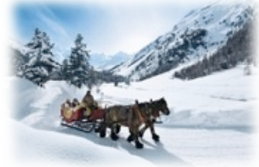
Val Roseg (GR)

Voyage à travers 150 ans de tourisme d'hiver.