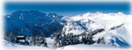
Portes du Soleil (VS)