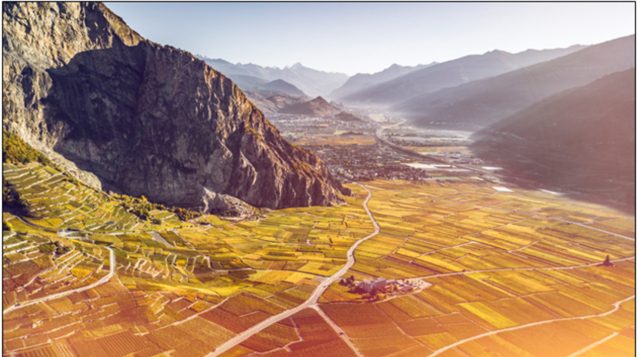
Blick auf die herbstlichen Weinberge im Rhonetal, Wallis.

Die hier präsentierte Auswahl von schweizweiten News gibt den Stand Mitte September 2021 wieder. Aufgrund der aktuellen Lage kann es zu Verschiebungen und Absagen kommen. Es wird empfohlen, die Informationen auf der erwähnten Webseite zu prüfen.