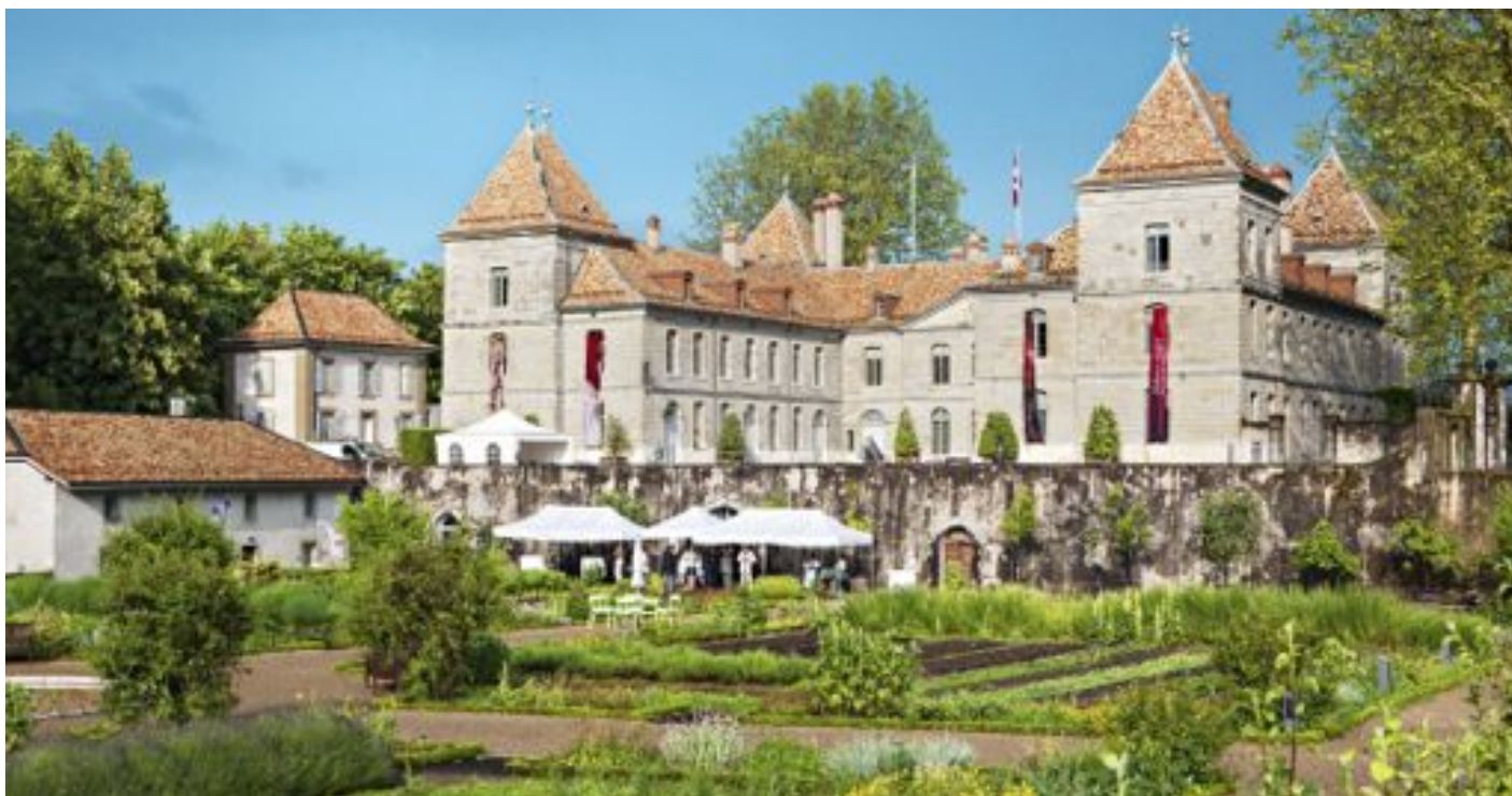
Château de Prangins, Waadtland