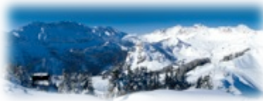
Portes du Soleil (VS)