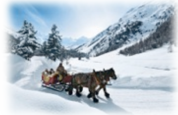
Val Roseg (GR)

Winter-Impressionen aus 150 Jahren – www.swiss-image.ch/gowinter