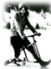
Portes du Soleil (VS)