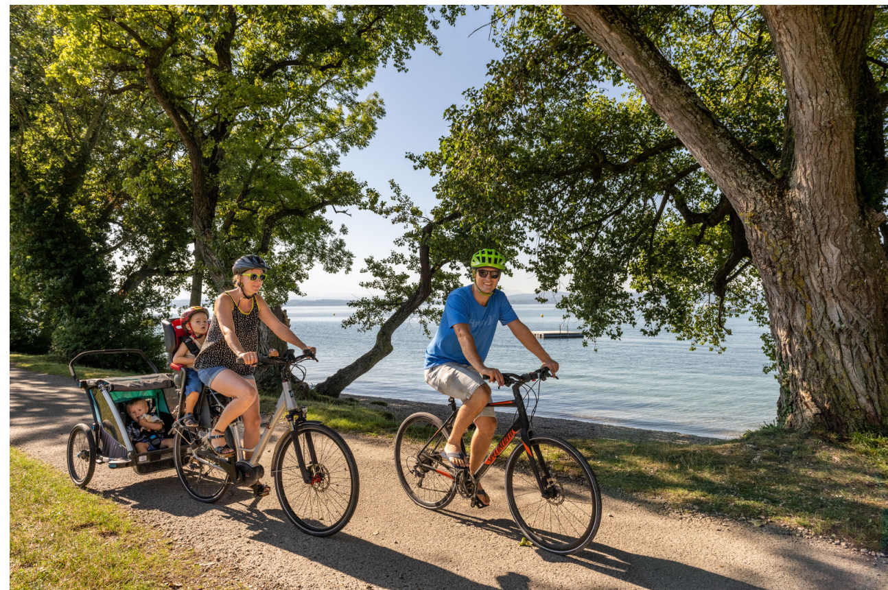
Plage de la Pointe du Grain