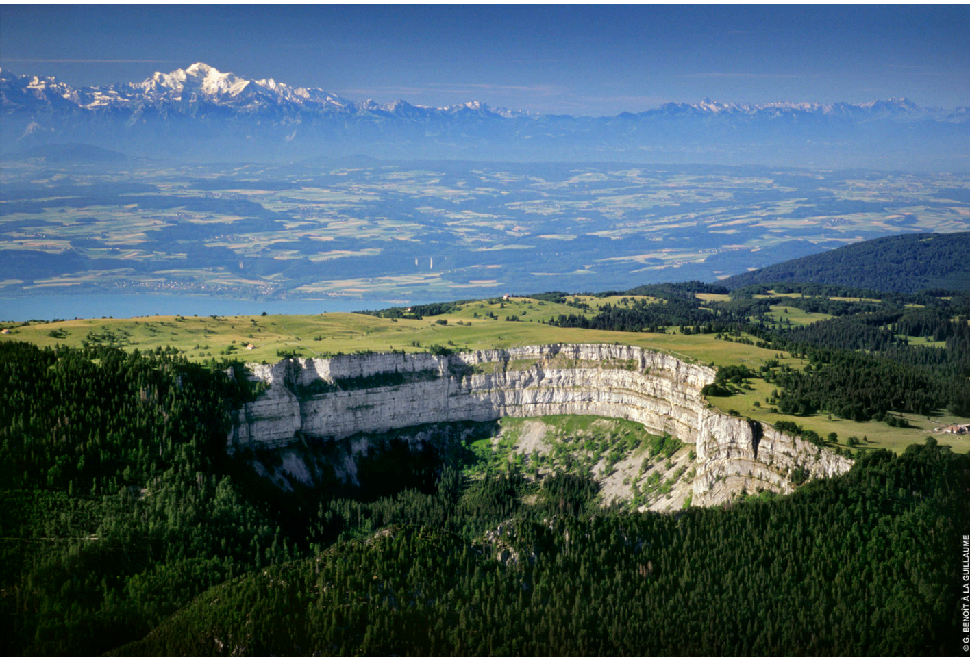
Creux du Van