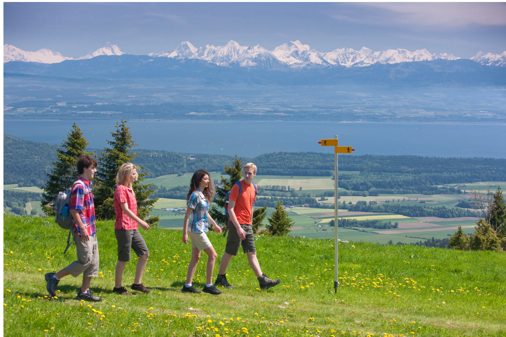
Vue des Alpes