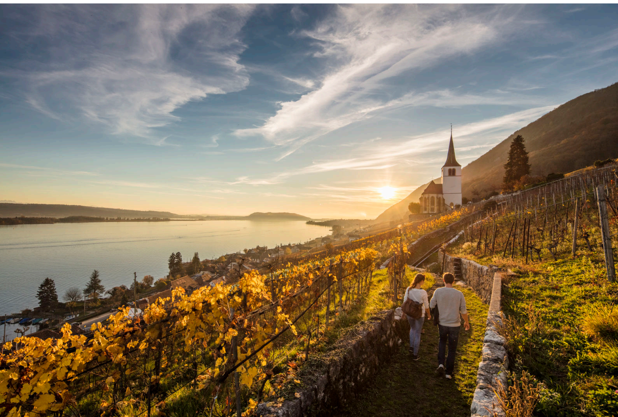
Ligerz (lac de Bièvre)