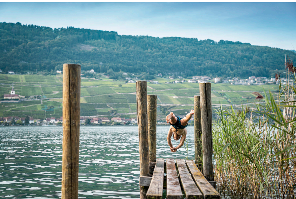
Hôtel du Cloître