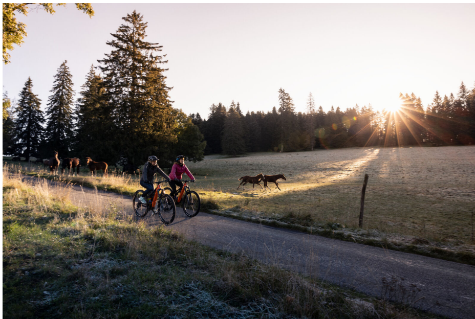
Etang de la Gruère