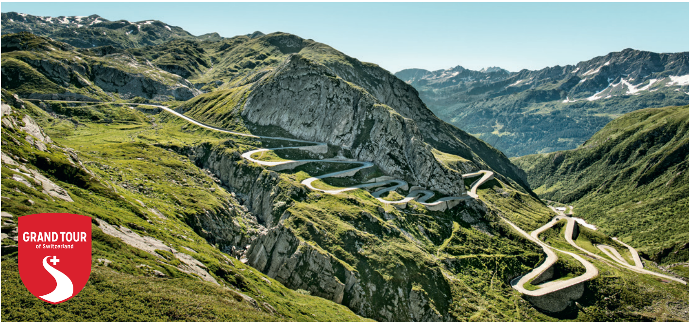
La Tremola, ancienne route du col du Saint-Gothard, Tessin